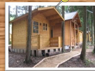
バンガローが12棟あります。