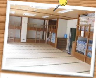
和室や大人数で泊まれる部屋があります。