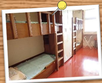
2段ベッドの8人部屋が多数あります。