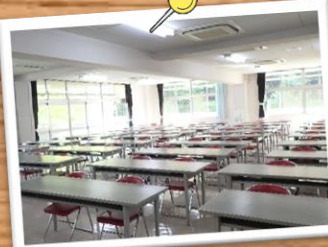
研修室が7つあります。