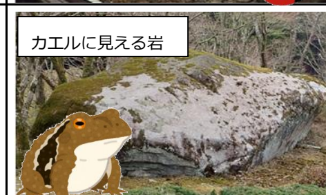
カエルに見える岩