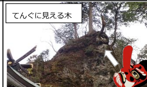
てんぐに見える木